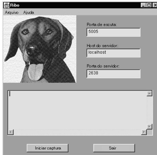
Figura 1-1: GUI do Ribo

Se você especificar a porta de escuta, o host do servidor e o servidor ao iniciar o Ribo , esses parâmetros serão preenchidos para você na tela do GUI.